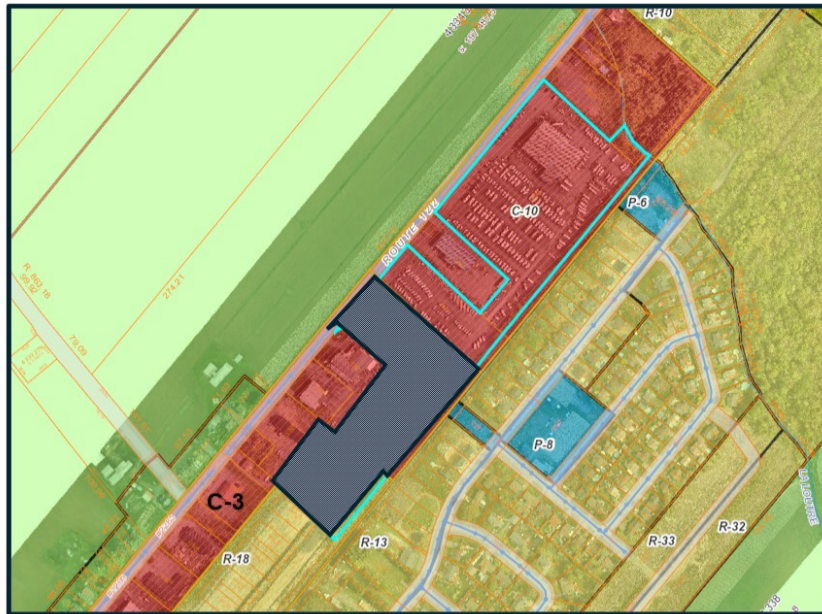
■ Agrandissement de la zone C-10 à même la zone C-3 et R-18

Le présent règlement entrera en vigueur conformément à la loi.